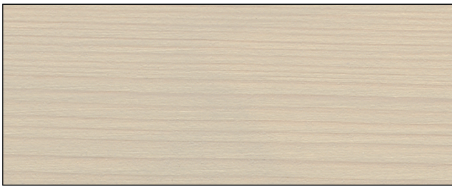
antikgrau ■ antique grey Art.-No. 2302