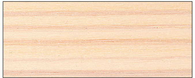
weiß ■ white Art.-No. 2401