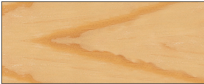
farblos ■ clear Art.-No. 2400