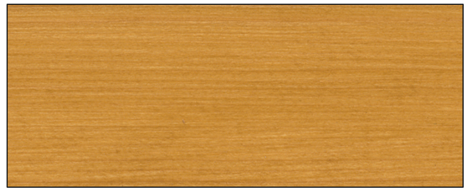
eiche ■ oak Art.-No. 2305