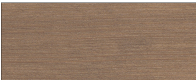
toskanagrau ■ tuscan grey Art.-No. 2308